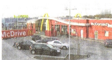
Das McDonalds am Heifeskamp in Dümpten.

So können sich Kinder verschiedenen Alters in einem Kletterwürfel und beim Basketball austoben oder im Hindernisparcours ihre Balance trainieren. Dabei können sie so laut sein wie sie wollen, denn während sich die Kinder im separaten Ronald Gym Club austoben, wartet auf die Eltern ein Coffeeshop-Angebot mit schnellem Service zu moderaten Preisen. „Mit Gym & Fun wollen wir unsere kleinen Gäste auf spielerische Weise zu Sport und Bewegung anregen.“